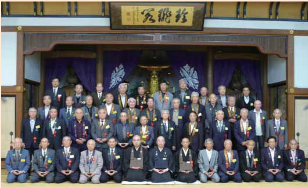
大本山永平寺講堂

雰囲気の中、永平寺に到着しました。境内は三方を山に囲まれた深山幽谷の地に建物が並んでおり、さすが曹洞宗の大本山と