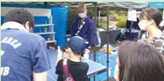
子供禅の集い盆踊り大会

令和四年七月二十三日には、宮城県第二教区青年会様の「子供禅の集い盆踊り大会」をお手伝いさせて頂きました。林松院様を会場に開催され、近隣の小学校の児童や保護者を中心に、地域住民の方々約四百名が来場されました。教化指導員は会場内に作られた射的場やヨーヨー釣りで子供たちを遊ばせたり、盆踊りを一緒に踊ったりしながら地域の方々との交流を深めました。特に保護者の方からは、コロナ禍によって子供たちの夏休みの思い出となる体験が減ってしまった中、とても有難い催しだったと感謝の言葉も頂戴しました。人が集まる場を設ける事が困難な時期に、こうした地域の方々とお寺のご縁を結ぶお手伝いをさせて頂き、教化指導員としてとても貴重な機会となりました。 今後も演劇活動をはじめ、出来る事をコツコツと行って参りたいと考えております。