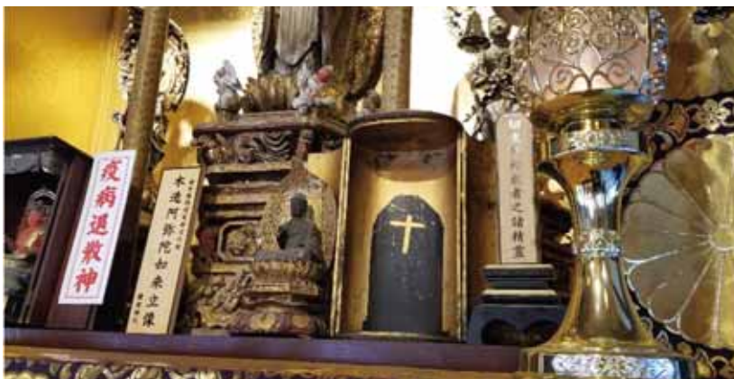
岩手県一関市 時宗 長徳寺

今後は立正佼成会↓神社庁の輪番となるが、五十年の節目に当たり代表として任務を果たしたい。