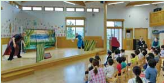
にじいろこども園演劇公演

てほしいと語りかける場面では、耳を傾ける子供たちの眼差しが次第に真剣になっていくのが印象的でした。