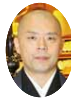
宮城県布教師協議会 布教部 理事